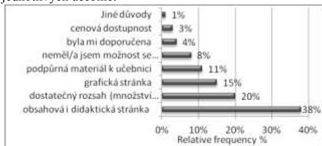
Graf 2 – Důvody výběru učebnice Nová škola

Z průzkumu dále vyšlo, z jakého důvodu pedagogové vybrali čítanky a slabikáře od nakladatelství Nová škola. Učebnice byly učiteli vybrány především podle didaktické a obsahové stránky (graf 2), dále podle dostatečného rozsahu (20 %) a grafické stránky učebnic (15 %). Výsledky korespondují s pořadím výběru jednotlivých učebnic.