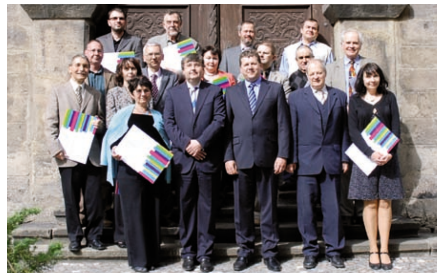
Pracovníci univerzity s nejvyšším bodovým hodnocením vědeckého výkonu.