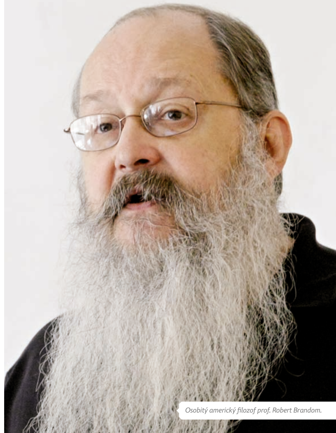
Osobitý americký filozof prof. Robert Brandom.

Přednášku následovala více než půlhodinová diskuse o Brandomově pojetí jazykových her a jeho kritickém navázání na Wittgensteinův pragmatismus, kdy přednášející musel obhájit svou pozici před početným publikem složeným nejen z pedagogů a studentů FF UHK, ale také ze zájemců o filozofii z řad hradecké veřejnosti, jakož i z filozofů a lingvistů, kteří do Hradce Králové přijeli z jiných univerzit s cílem vyslechnout si pečlivě formulované teze tohoto předního amerického myslitele.