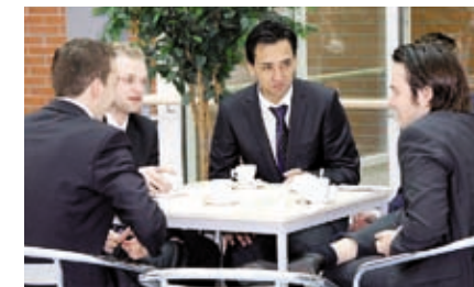
Nizozemští studenti v odborné rozpravě.

minut. Zajímavé pro posluchače bylo zjištění, že prý téměř všichni v Nizozemsku nakupují potraviny přes Internet. Druhý jmenovaný prezentoval velmi vyspělý městský informační systém pro veřejnou správu i veřejnost, jenž využívá data z katastrálního úřadu, ze sčítání osob, ale dozvíte se také, kde jsou sportoviště, přípojky energií, svoz odpadu apod. Pro veřejnou správu jsou poté přítomna i podrobnější data např. o národnostním složení v jednotlivých domech, a projekt tedy může sloužit jako systém včasného varování před tvorbou ghett. Pokud si chcete prohlédnout budoucnost integrace informačních systémů veřejné správy, navštivte http://kaart.almere.nl/Map.aspx .