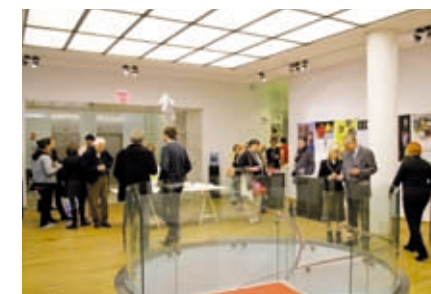
Nový (z)boží 2010! / New G(o)ods 2010!