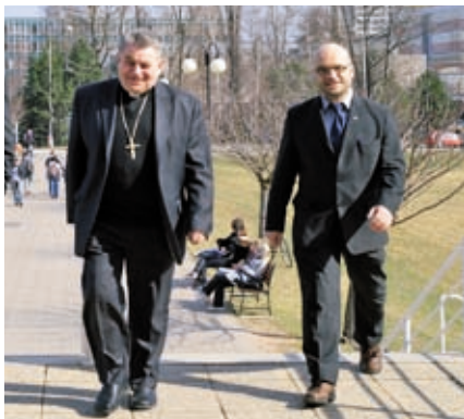
Univerzita opět vítá pražského arcibiskupa Dominika Duku.

což současně znamená výchovu ke svobodě. Osobnost je formována interdisciplinárním kontextem, vědomím souvislostí. Přitom suma vědomostí je tu ve funkci dosažení moudrosti. Arcibiskup se zamýšlí, zdali není nutné znovu promýšlet systém vzdělávání pod zorným úhlem člověka jako osobnosti, tedy člověka moudrého. Moudrost a vzdělání jako moudrost v sobě zahrnuje svobodu a zodpovědnost. Současně dominující životní styl však usiluje o co nejméně starostí, cílem je kvantita za každou cenu, extenze za každou cenu, člověk důvěřuje, že veškeré problémy vyřeší peníze. Ideálem není být moudrý, ale být šťastný, čímž je myšleno být co nejméně zodpovědný. Podle arcibiskupa Duky je třeba v pedagogické práci hledat důvody, pro které vychovávám druhého, a to současně předpokládá i vychovávání sebe samého.