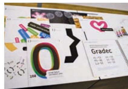
Ukázka z newyorské expozice.