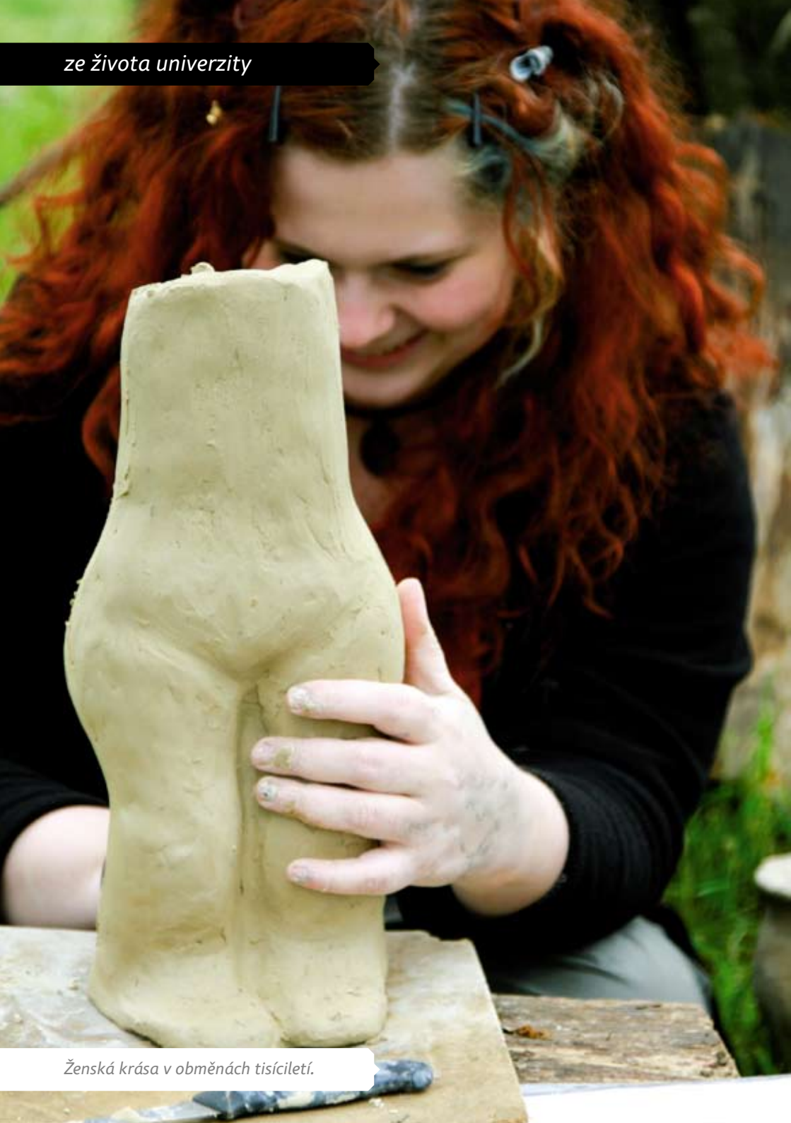
Ženská krása v obměnách tisíciletí.