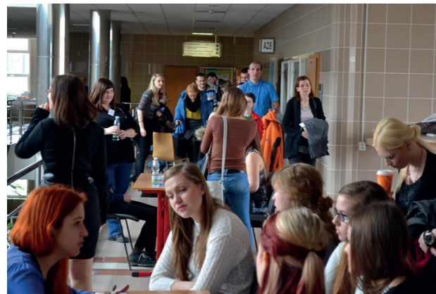
Fotografie průběhu projektu Rande s předsudkem