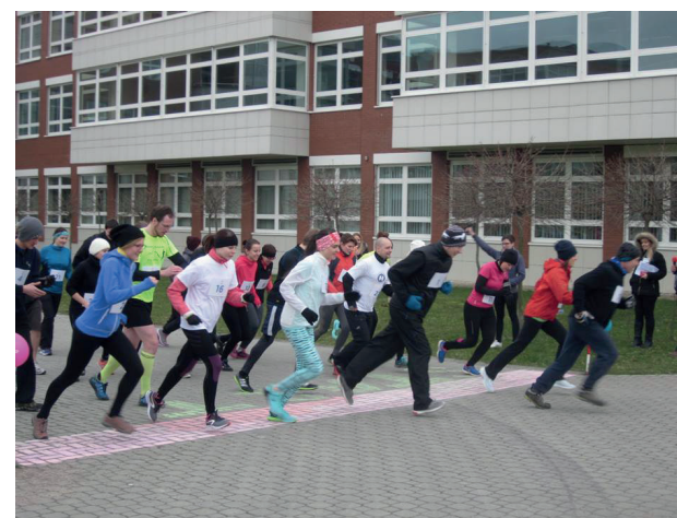
Fotografie průběhu projektu Vyběhneme s násilím