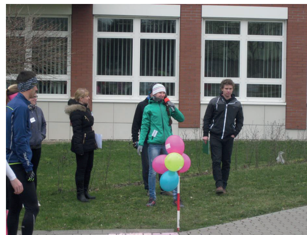
Fotografie průběhu projektu Vyběhneme s násilím