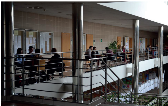
Fotografie průběhu projektu Rande s předsudkem

Po obědové pauze ve 13:00 i v návaznosti na úspěšné dopoledne dorazilo nespočet účastníků a kapacita se nám naplnila hned několikrát. Spontánně se tedy vytvořily u stolečků rovnou celé skupinky a naši odvážní hosté se snažili o svůj život podělit rovnou s celou skupinkou. Některým účastníkům se dokonce i po zakončení nechtělo rozloučit a rozmlouvali u stolečků i nadále. Z dotazníků byla celá akce velmi chválena a někteří účastníci se dožadovali dalšího ročníku. Tak se třeba nižší ročníky inspirují a naváží na povedenou akci i za rok!