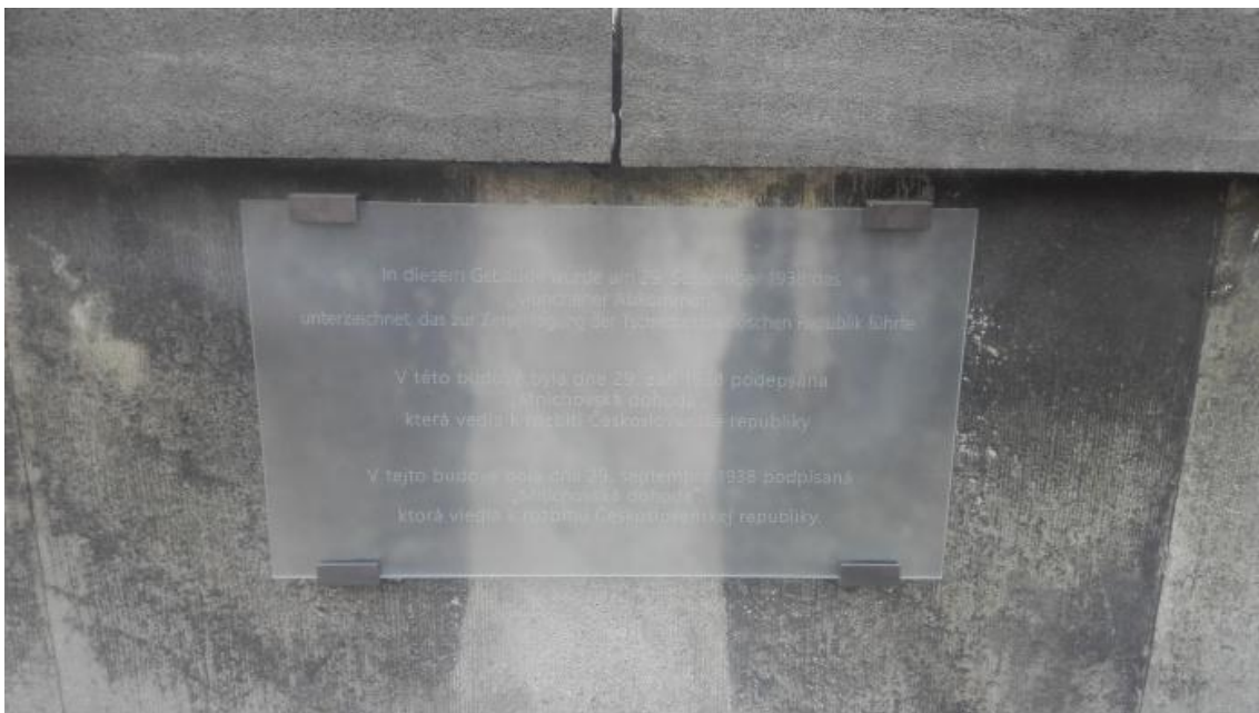
Pamětní deska na budově Hochschule für Musik und Theater München