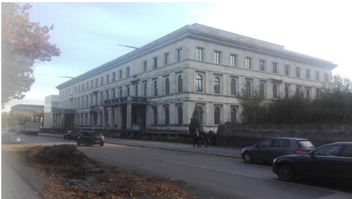
Místo podpisu Mnichovské dohody, nyní Hochschule für Musik und Theater München

Do hlavního města Bavorska jsem se vydal přesně 79 let po podpisu Mnichovské dohody, tedy 30. září 2017. A už samotná cesta toto „výročí“ symbolizovala. Na trase vlakového spojení Praha – Mnichov ve městě Schwandorf byla nalezena bomba z druhé světové války, a tak jsem byl donucen vystoupit již kousek za hranicemi ve městě Furth im Wald.