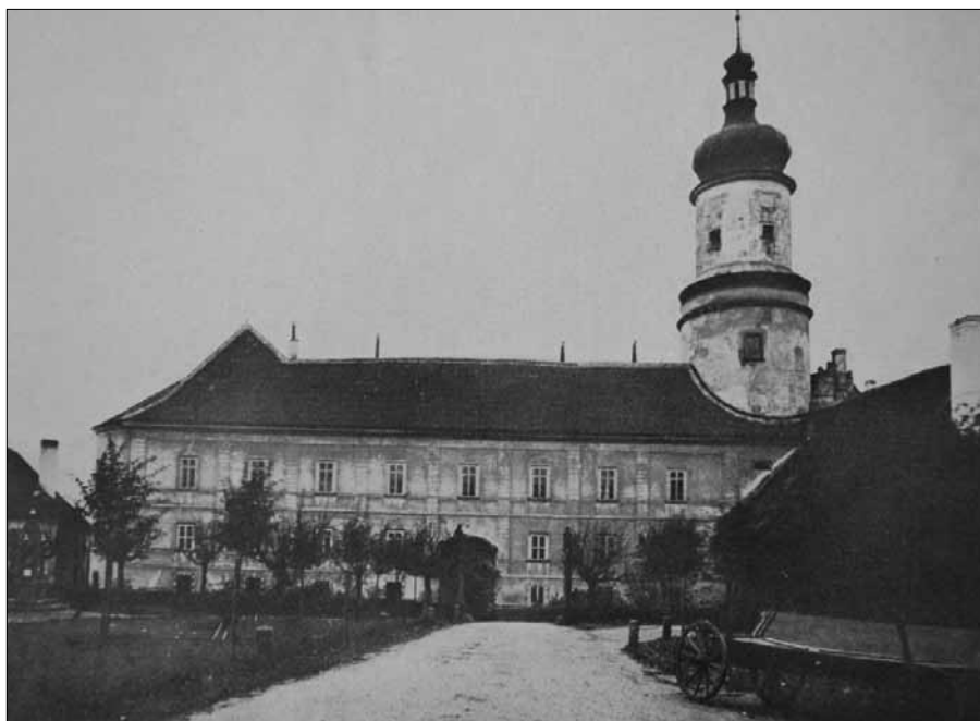
Obrázek 3 – Stav novoměstského zámku z doby před jeho renovací pravděpodobně v roce 1908, nedatováno. 25