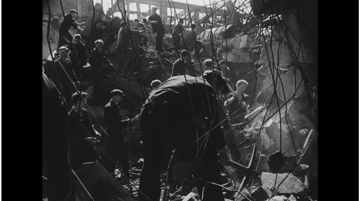
Záběr z dokumentárního filmu Kováci režiséra Jiřího Krejčíka, 1946.

Z celkem patnácti kapitol, které společně nabízí jedinečné transnacionální vyprávění o obnově veřejného prostoru v Evropě, může české publikum ocenit například téma Zkáza a znovuzrození uměleckého dědictví , jež se věnuje stavební rekonstrukci kulturních památek zničených válkou. Ukazuje domácí symbol válečné zkázy, jímž se stala Staroměstská radnice, kterou nacisté vypálili během Pražského povstání, a z pozdější doby upozorňuje na pozoruhodný příběh obnovy Betlémské kaple.