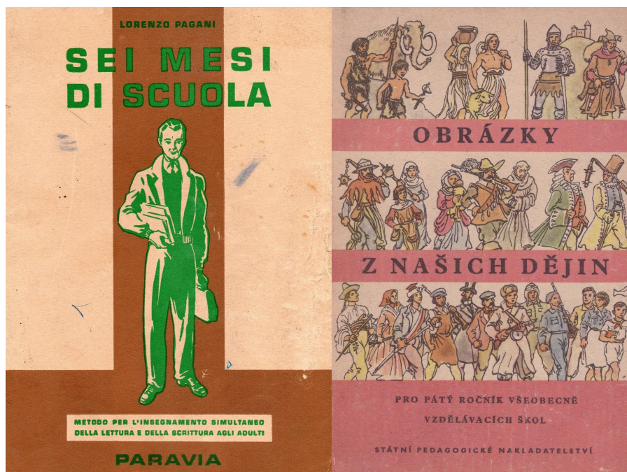
Titulní strana italské a české poválečné učebnice, 1959.

Důležitou součástí výstavy jsou učební materiály a soubory e-learningových aktivit, které jsou určeny pro studenty ve věku 14 až 18 let, ale lze je přizpůsobit i mladším žákům. Dvanáct hlavních aktivit, které navazují na témata výstavy, je navržených tak, aby v rámci jedné vyučovací hodiny (45 minut) motivovaly studenty ke kritickému pochopení historického tématu. Pět kratších aktivit, které by měly trvat přibližně 15 minut, se věnuje konkrétním filmovým formám. V každém případě jsou studenti vedeni ke kritickému vnímání obrazového a filmového materiálu, což je dovednost, kterou zdaleka nevyužijí jenom v hodinách dějepisu.