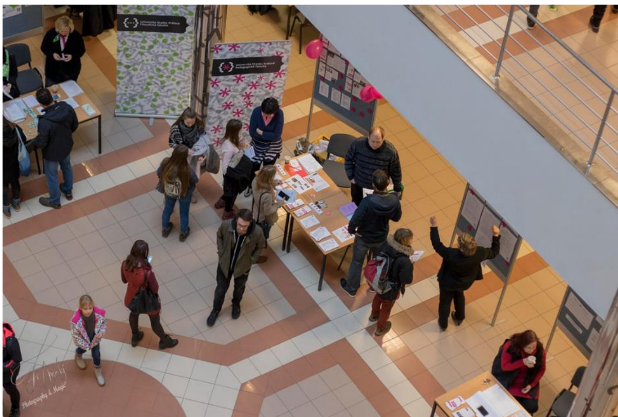
Obrázek 4 a 5 – Den otevřených dveří, leden 2017