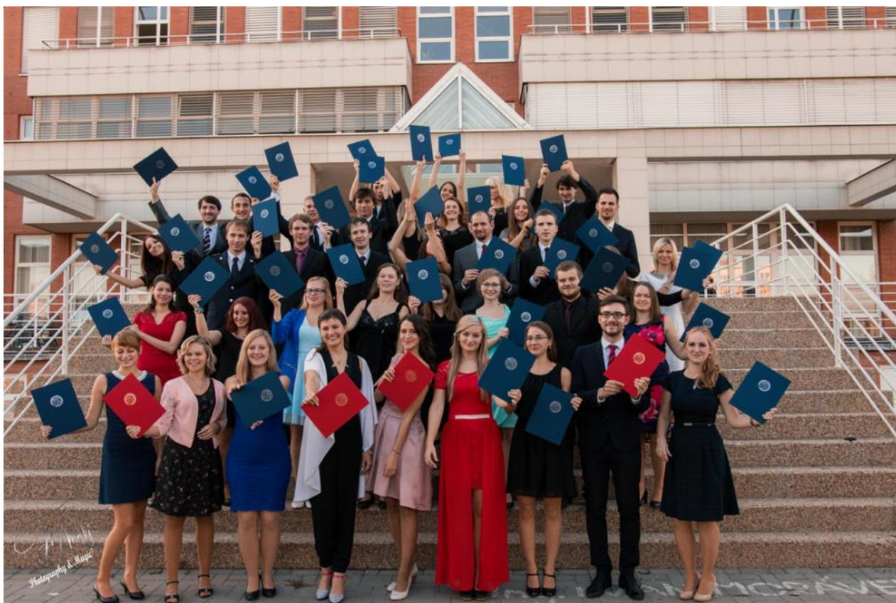
Obrázek 6 a 7 – Promoce absolventů fakulty, červen a říjen 2017