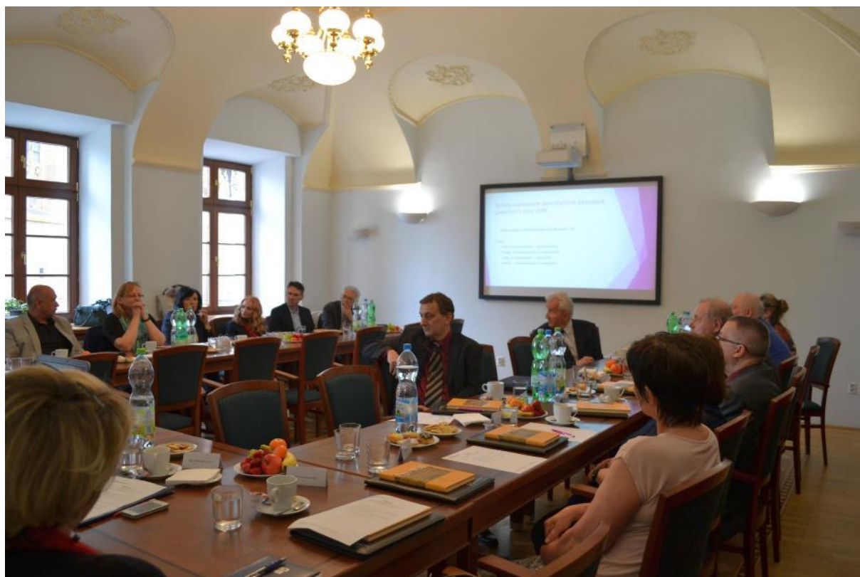
Obrázek 3 – Vědecká rada, zasedání dne 26. 4. 2017