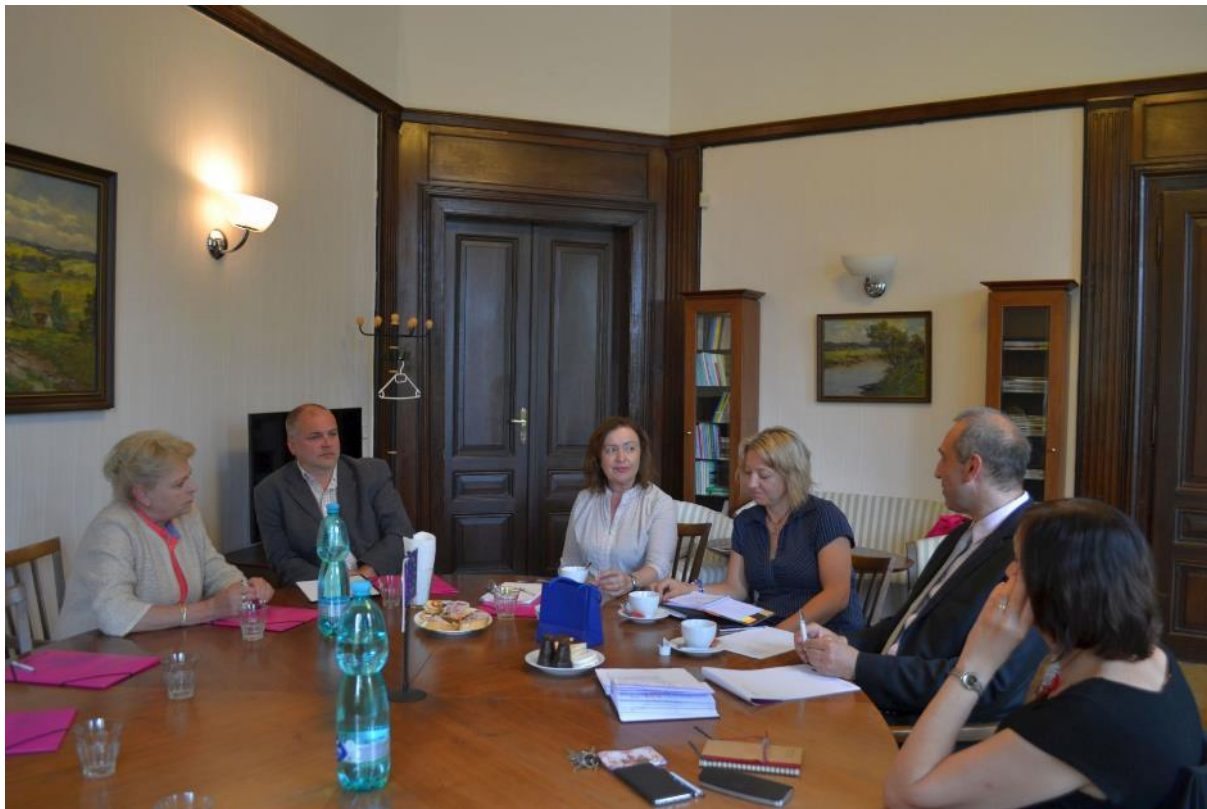
Obrázek 8 – Zasedání Rady pro spolupráci s praxí

Součástí tohoto projektu je i zavedení jednotného informačního systému vedení všech praxí na PdF.