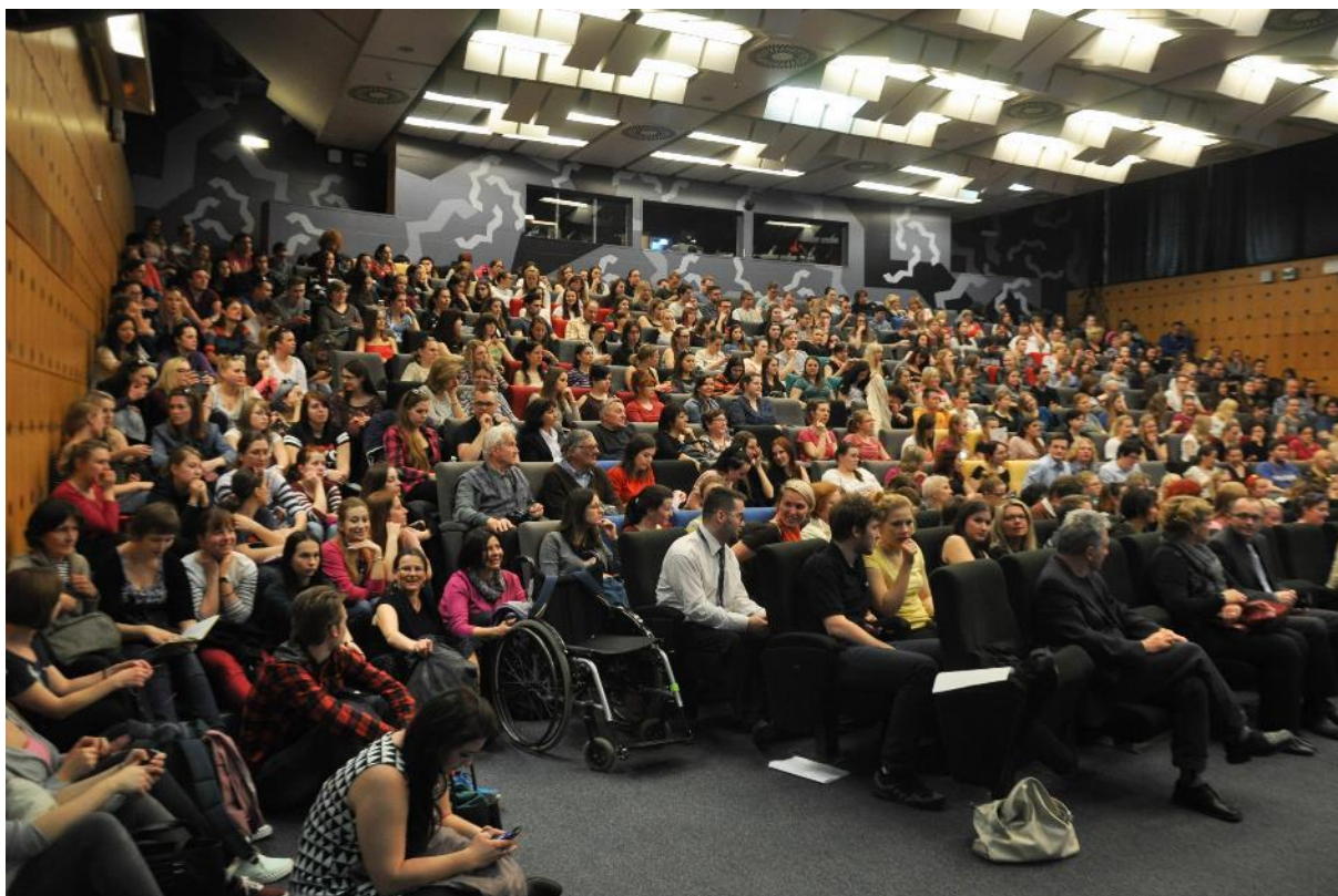
Obrázek 9 – Auditorium hlavní přednášky Pedagogických dnů 2017, kterou pronesl Václav Moravec

Zejména jazykové katedry spolupřádaly řadu soutěží, jakými byly kupříkladu krajské kolo soutěže v anglickém jazyce pro střední školy Královehradeckého kraje a Pardubického kraje (Katedra anglického jazyka a literatury) nebo Ars poetica – Puškinův památník, regionální recitační soutěž v RJ pro ZŠ a SŠ pro Královehradecký a Pardubický kraj (Katedra ruského jazyka a literatury).