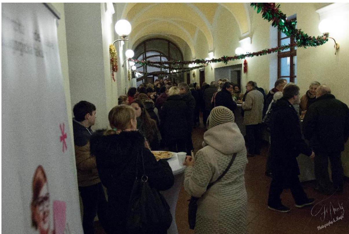
Obrázek 11 – Setkání zaměstnanců fakulty na adventním koncertě, prosinec 2017