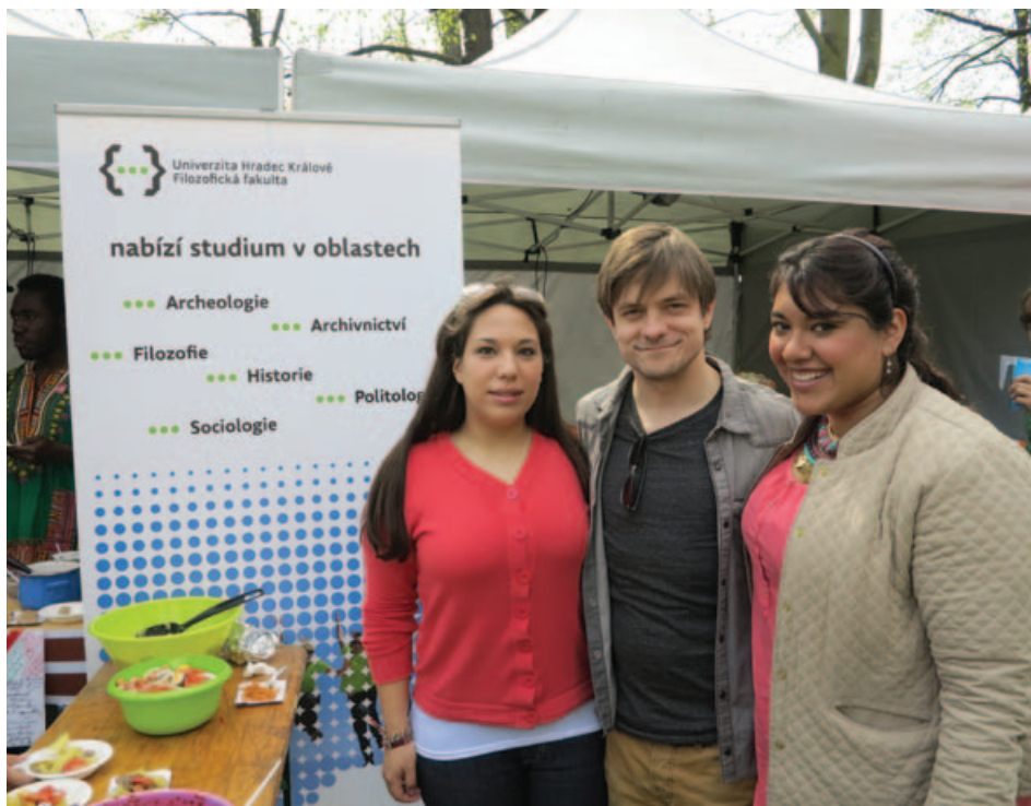
Latinskoamerickou kuchyni si na Majálesu nenechal ujít ani známý herec Jiří Mádl.

„Hradec Králové je skvělým místem na bydlení i studium. Univerzita je úžasná a nabízí kurzy velmi dobrých odborníků. Velmi jsem si pobyt zde užila, byla to pro mě výborná životní zkušenost. Jsem vděčná, že jsem tu mohla být.“