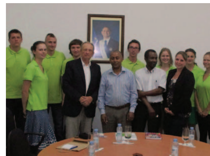
Studenti Univerzity Hradec Králové s ministrem školství Kapverdských ostrovů.

Krásu Kapverd oceníte, jestliže navštívíte více ostrovů. Každý z nich je zajímavý a má svá specifika. Ostrovy rozhodně nejsou jenom „slunce a pláž“. Žijí specifickou kulturou, bohatou historií, pohodovým stylem života a jsou otevřeny celému světu.