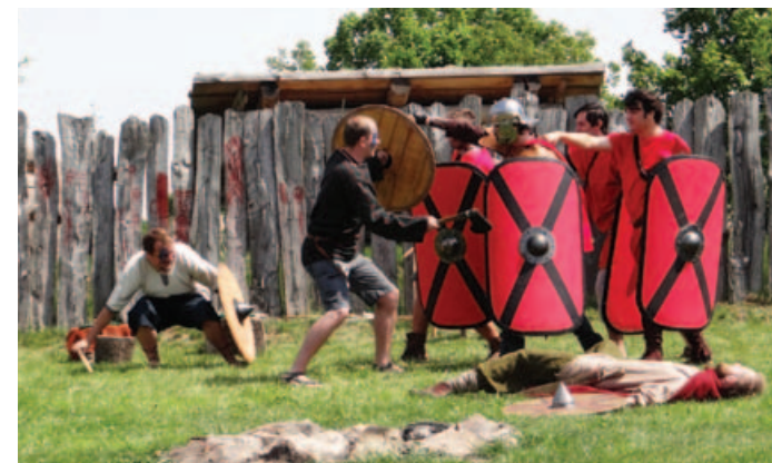
V archeoparku se při Dnech živé archeologie odehrávají lité bitvy