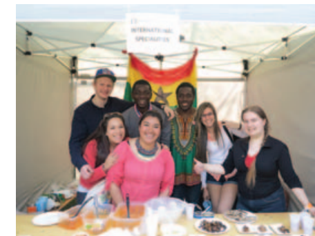
Zahraniční studenti zazářili s ochutnávkami svých národních pokrmů na hradeckém Majálesu 2015

Letní semestr měli jejich kolegové zpestřený o aktivní účast na hradeckém Majálesu. Ochutnávky mezinárodní kuchyně se opět osvědčily. Od