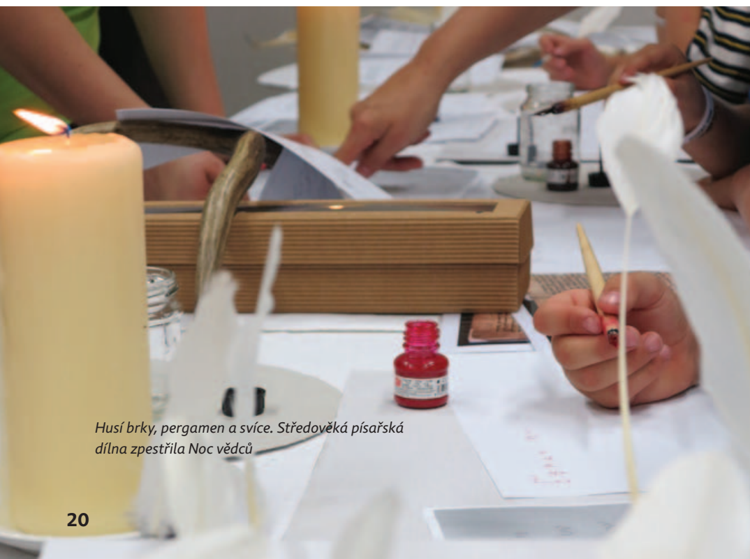
Husí brky, pergamen a svíce. Středověká písárská dílna zpestřila Noc vědců

Návštěvnost přednášek i zábavných akcí filozofické fakulty roste a její vedení hodlá nabídku volnočasových aktivit pro všechny věkové kategorie v nadcházejících letech ještě rozšířit.