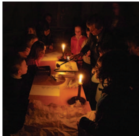
Školáci vyplnili husím brkem písanku a opatřili listiny pečeti

Překvapené děti nahlédly do činnosti kanceláře, královna jim ukázala pečeti králů a královen, vysvětlila výrobu a přípravu pergamenu. Pod písařovým bdělým dozorem si i s paní učitelkou vyzkoušely psaní brkem do připravených písanek. Nadšení adepti na přijetí do písařské dílny porozuměli, že se starými písmy to není až taková legrace. Velkou atrakcí pro malé návštěvníky představovala příprava vosku a pečetení za pečlivého vedení paní kancléřky. Když královna po hodině a půl audienci ukončila