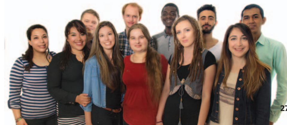
Skupinový snímek zahraničních studentů z letního semestru 2015

Studenti překvapovali také své vyučující, a to čím dál lepší češtinou. Ně-