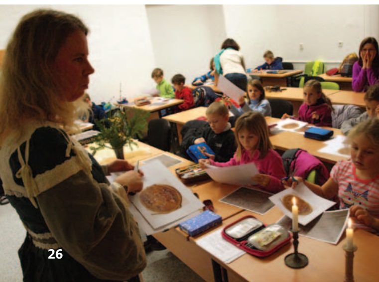
Školáci napjatě poslouchali královnu Kunhutu

a rozdala hostům drobné upomínkové předměty FF UHK, nechtělo se mnohým z nich vůbec odcházet. A to je dobře. Za pár let už aspoň někteří nemusí být jen návštěvníky, ale mohou se stát studenty katedry i fakulty a poznat další taje naší historie.