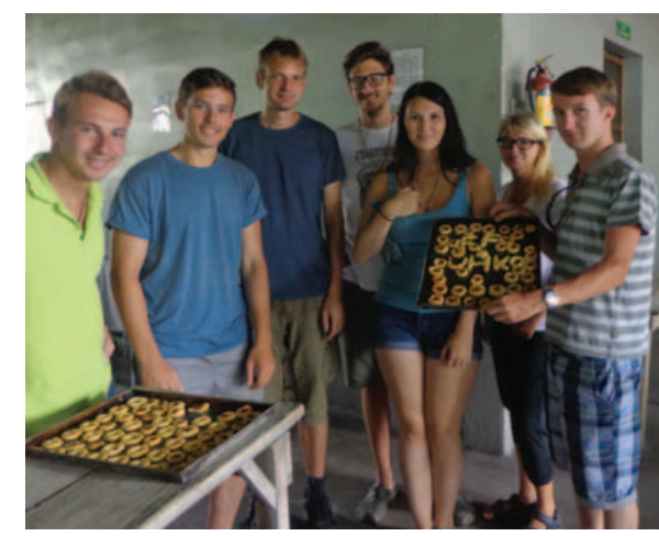
FF UHK se stala ozdobou nikaragujské pekárny.

Pro mě osobně bylo velkým přínosem exkurze do Nikaraguy setkání s realitou sociálního žití v chudé zemi. Dokud se o bídě, sociálních rozdílech ve společnosti, nedostatku zdravotní péče a jiných problémech mluví pouze v televizi, člověk si tyto problémy nedokáže dostatečně představit. Na druhou stranu mě uchvátila fauna i flora Nikaraguy, která je naprosto úžasná. Příjemným překvapením byl také přístup průvodců. Musím říci, že celkově na mě lidé v Nikaragui působili pozitivně a přátelsky.