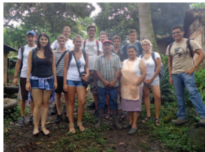
Hradecká politologická expedice na kávové plantáži

Díky spolupráci hradecké a leónské univerzity jsme měli také možnost být součástí jejich programu na pomoc nejchudším komunitám v Leónu. A nutno říci, že do této chvíle jsem si nedovedl představit, jak vypadá opravdová chudoba. Jednu místnost zde leckdy obývá i dvacet lidí, myšlení a nástroje jsou bez přehánění i dvě stě let zpátky. Samozřejmě jsme procestovali i okolí Leónu, například sopku Cerro Negro, León Viejo či pláž Las Peñitas u Tichého oceánu.