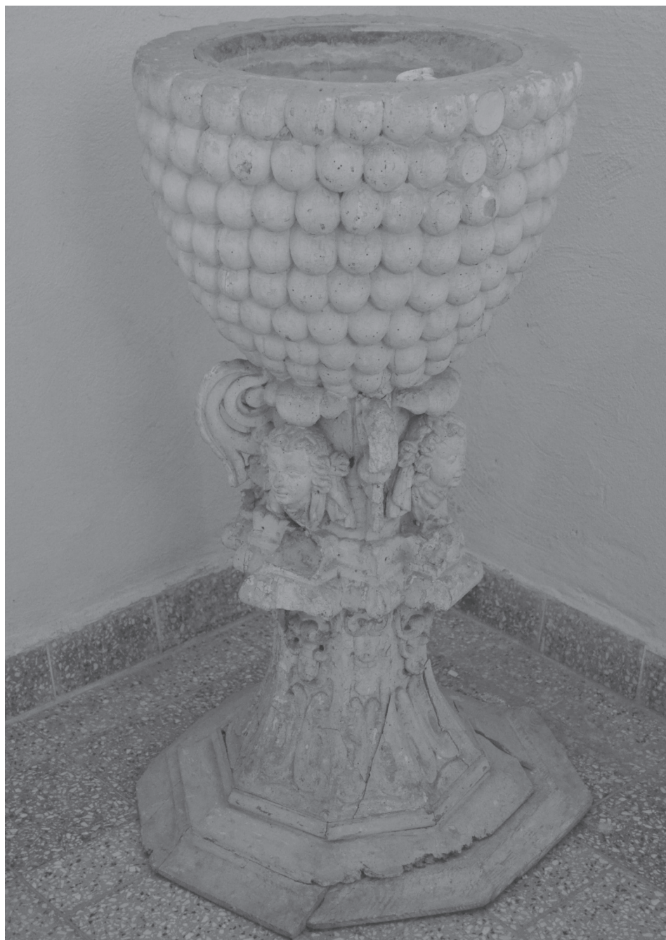
Autor nieznany, chrzcielnica z kościoła pw. Narodzenia Najświętszej Marii Panny w Ręszowie, 1653 r.