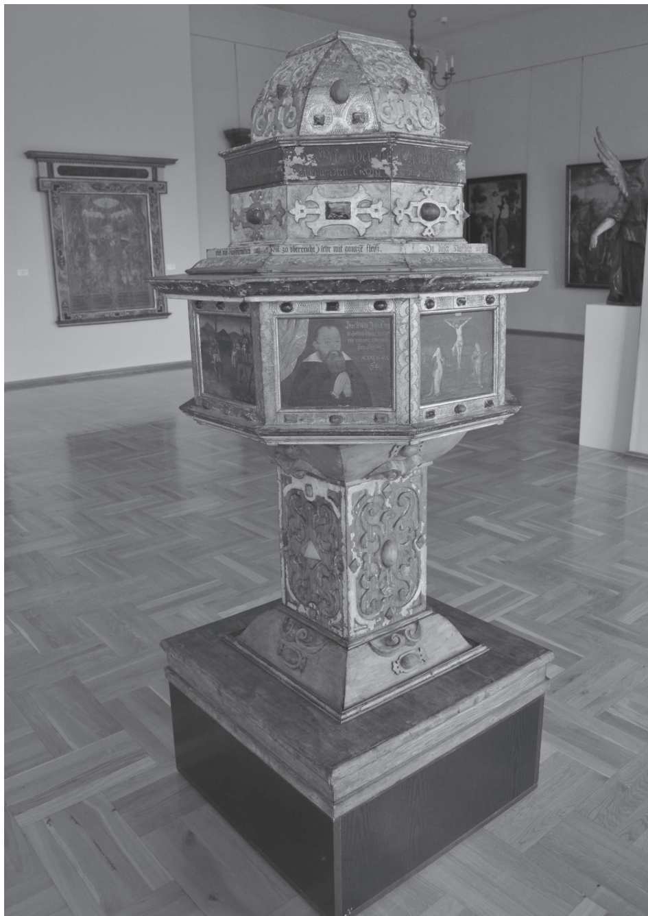
Autor nieznany, chrzcielnica z Konina Żagańskiego, ob. Muzeum Piastów Śląskich w Brzegu, 1614 r.