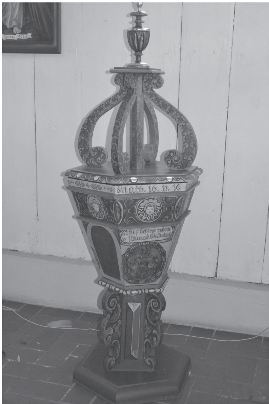
Autor nieznany, chrzcielnica z kościoła pw. św. Jacka w Miechowej, 1628 r.