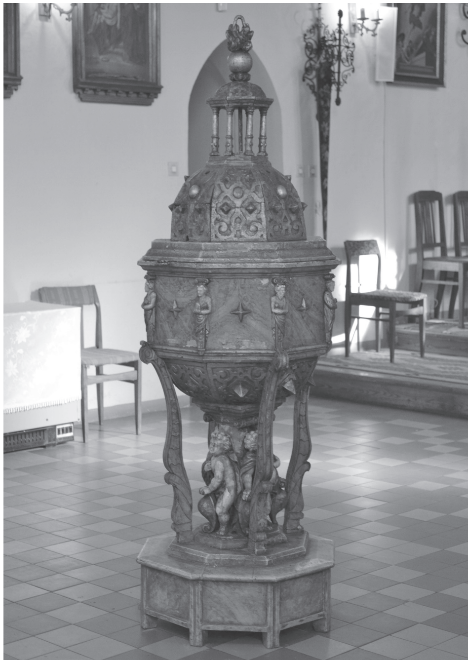
Autor nieznany, chrzcielnica z kościoła pw. św. Mikołaja w Jeleninie, ok. 1600 r.