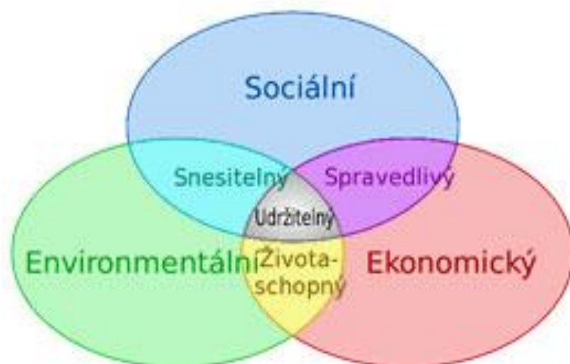
Obr. č. 1: Model udržitelného rozvoje