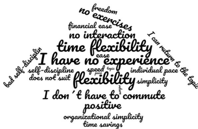
Figure 1: Advantages and disadvantages of E-learning

We can state that the definition of advantages and disadvantages was balanced by the respondents. For better clarity, graphic representations using the WordCloud technique were used (viz Figure 1). This view reflects the fact that several respondents stated in their answers that they have no experience in using distance forms of education. We can mention the flexibility of distance education as the main, most frequently mentioned positively. In parallel, time flexibility was often mentioned. This can be reflected in the fact that those attending classes do not have to commute, i.e., saving time and money. However, these categories appeared separately. (Květenská, Prokopová, Myška, 2019)