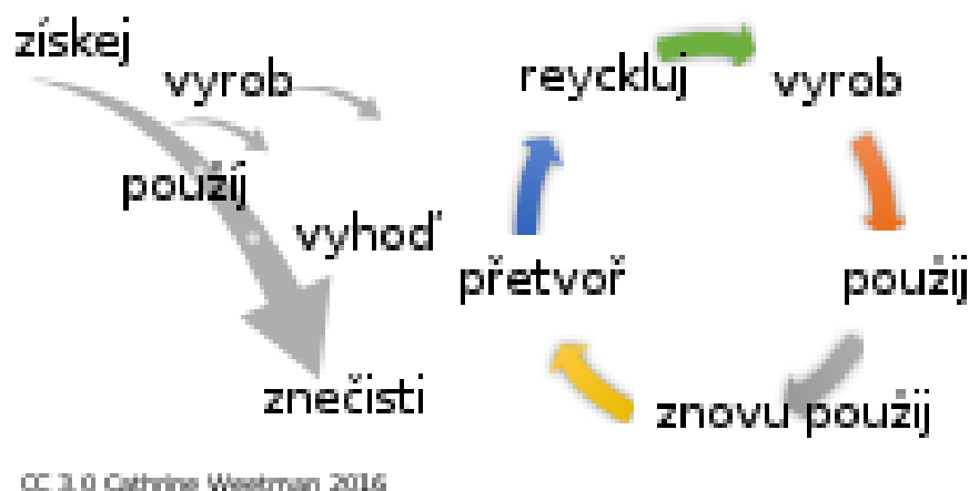
Obr. č. 2: Model lineární a cirkulární ekonomiky