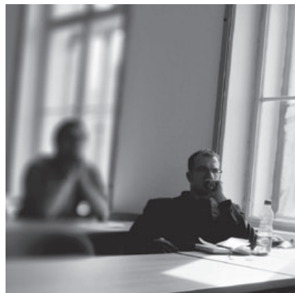
Historická zamyšlení hradeckých badatelů v dobách minulých.

„Průběh devátého ročníku konference potvrdil vzrůstající odbornou úroveň celé této tradiční akce. Téměř osm desítek přihlášených a více než šedesát aktivních účastníků, reprezentujících dvě desítky vědeckých a pedagogických pracovišť, dokládají vysoký zájem odborné veřejnosti,“ zhodnotil letošní ročník konference jeden z jejích pořadatelů doktor Tomáš Hradecký.